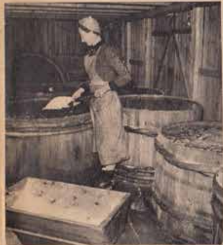
Täfteå har eget salteri, men i år saltade man ej mycket, ty efterfrågan på färsk fisk var rekordartad i fjol.