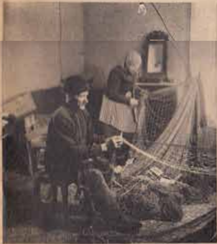
Lagning av fiskeredskap hör till vinterarbetet. Nya redskap är svårt att anskaffa och stiger våldsamt i pris.